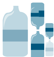
PET y HDPE