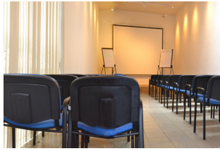
Capítulo VII Capacitación y Fortalecimiento Institucional. Capítulo 31