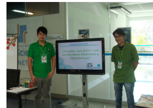
Capítulo V Participaciones especiales Página 26