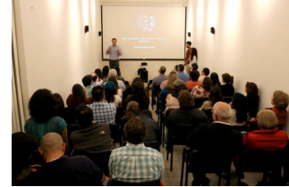
Capítulo II Casa Cem Página 10