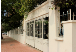
Carta Bienvenida Página 3