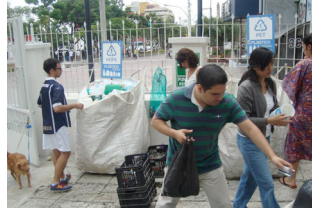
Capítulo I Proyecto Ecovia Página 4