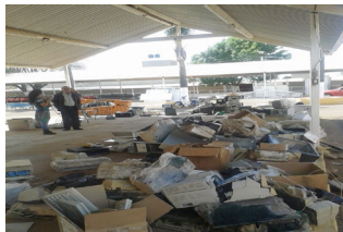
Capítulo III Macro-campañas Página 24