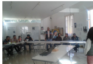
Capítulo IV Comité para la Gestión Integral de Residuos Peligrosos y de Manejo Especial Domésticos del Estado de Jalisco Página 26